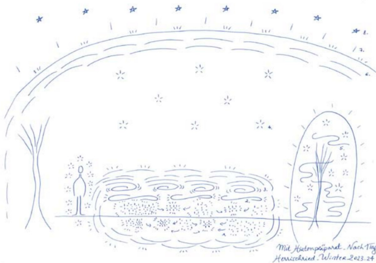
Abb. 3: Skizzenhafte Darstellung der Kräftesituation einer Wiese, Winter Feb. 2024, einen Tag nach Zugabe des Hirtenpräparats (siehe Auflistung unten für Erläuterungen)