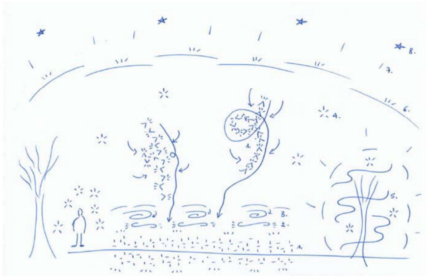
Abb. 2: Skizzenhafte Darstellung der Kräftesituation einer Wiese, Winter Feb. 2024, kurz nach Zugabe des Hirtenpräparats (siehe Auflistung unten für Erläuterungen)

Insgesamt anregend belebt, wach und in zarter, fein strukturierter Aktivität, dabei auf die Erdtätigkeiten ausgerichtet und diese belebend, einbindend und harmonisierend; auf seelischer Ebene werden Qualitäten wie von Reinheit wahrgenommen, die Herzkkräfte werden angeregt, das Herz öffnet sich und wird durchwärmt in ruhiger, mütterlicher Stimmung in Liebe, Demut und Hingabe: