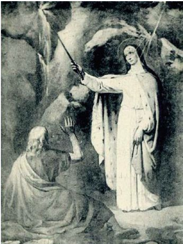
Abb. 2: Darstellung zur Entstehung der Odilienquelle*

verfolgte seine Tochter, die in der letzten Verzweiflung in einem sich hinter ihr schließenden und sie schützenden Felsspalt Zuflucht fand. Dieses Ereignis soll im Mußbachtal oberhalb von Freiburg im Breisgau, wo heute noch der Odilienstein, die Ottilien-Kapelle und eine Quelle zu finden sind, oder – nach anderen Angaben – in der Eremitage von Arlesheim bei Basel stattgefunden haben. 5 Herabstürzende Steine verwundeten den vor diesem Ereignis staunenden und innerlich erschütterten Vater, er gab seine Verfolgung auf und wurde von seinen Dienern wieder zurück gebracht. Nach einiger Zeit besuchte Odilia den inzwischen innerlich bekehrten Vater, der sich mit ihr versöhnen wollte, und erhielt von ihm den Platz auf der Hohenburg – den heute nach ihr benannten Odilienberg –, um das erste Frauenkloster des Elsass zu gründen. Das Kloster wurde von vielen Kranken aufgesucht. Eines Tages – so die Legende – sah Odilia einen erschöpften, dürstenden alten Bettler den Berg hochpilgern.