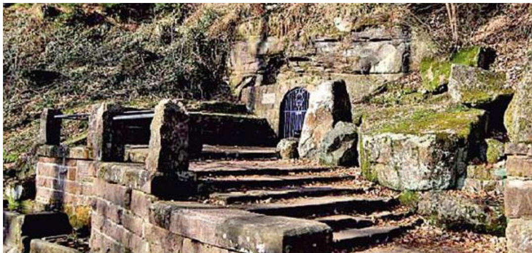
Abb. 3: Der ausgebauter Zugang zur Quelle mit Becken*

Die kleine Sturzquelle entspringt aus einem Spalt unterhalb des Klosters. Den Quellenaustritt schützt ein Gitter. Das Einzugsgebiet besteht hauptsächlich aus Buntsandstein und Konglomerat, es ist besonders geprägt von dem ehemaligen Kloster – heute ein Wallfahrts- und Seminarort – und ist sonst von Wald bedeckt. Der Ursprung der Quelle ist bis heute noch unbekannt. Sie hat eine geringe Schüttung, die bei ca. 1-2 l/Min. liegt.