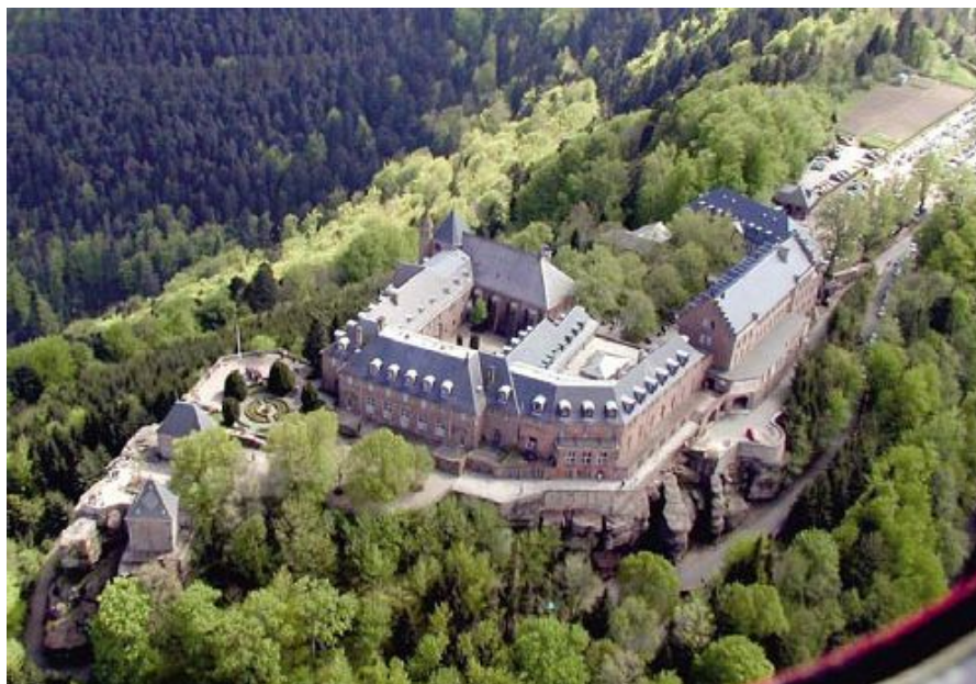
Abb. 1: Der Odilienberg mit seinem Kloster*

schwere Flaschen füllen möchte, kann auch über eine kleine Straße zur Quelle gelangen.