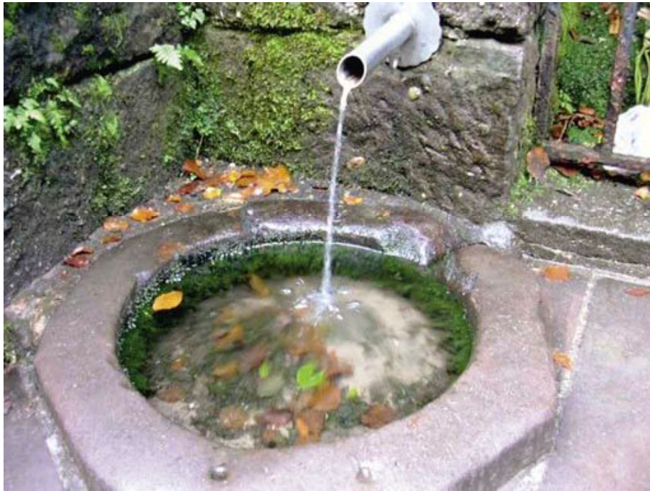
Abb. 4: Sanft klingend fließt das Wasser der Odilienquelle*